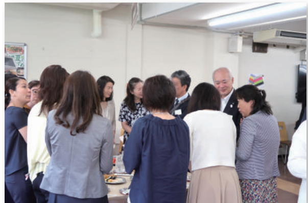
懇親会（保護者と学長との談話風景）