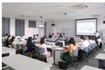
学部別懇談会（経済学部）