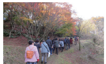
理学部附属植物園