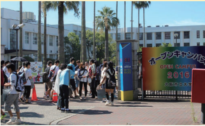
オープンキャンパス