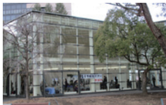
就職支援セミナー