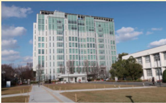
学術情報総合センター