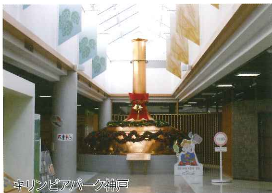
麒麟ビアパーク神戸

神鋼神戸発電所（灘浜サイエンススクエア）と麒麟ビール神戸工場を貸切バスで巡ります。神鋼神戸発電所では、普段見ることのできない発電の仕組みや発電施設を見学します。施設内の高さ77メートルのボイラ建屋屋上から眺める神戸港はまさに絶景です。神戸市内の料理店で昼食休憩を取った後、麒麟ビール神戸工場へ移動します。今まさにビールを製造している工場ラインを見学しながら、ビールのこだわりの製法やうまさの秘密を体感。勿論ビールの試飲もたっぷり楽しめます。快適なバスツアーで、初夏の神戸を一日思う存分楽しんでください。