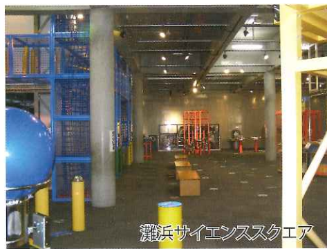
灘浜サイエンススクエア