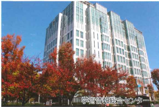
学術情報総合センター

講演のあとの懇親会では研究科長（学部長）や学部の先生と楽しくお話いただき、有意義な半日を市大杉本キャンパスでお過ごしく下さい。